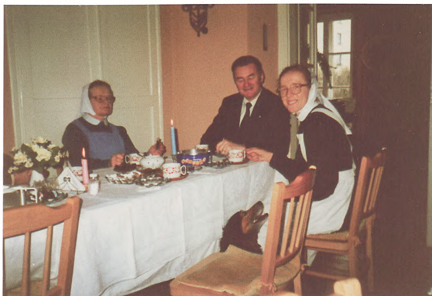
Z diakonisami w Węgrowie