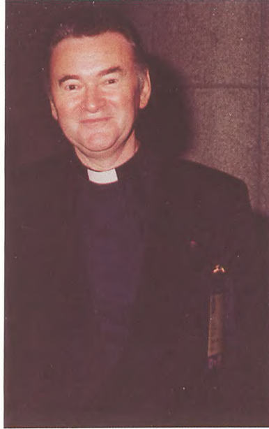
Podczas konferencji kapelanów