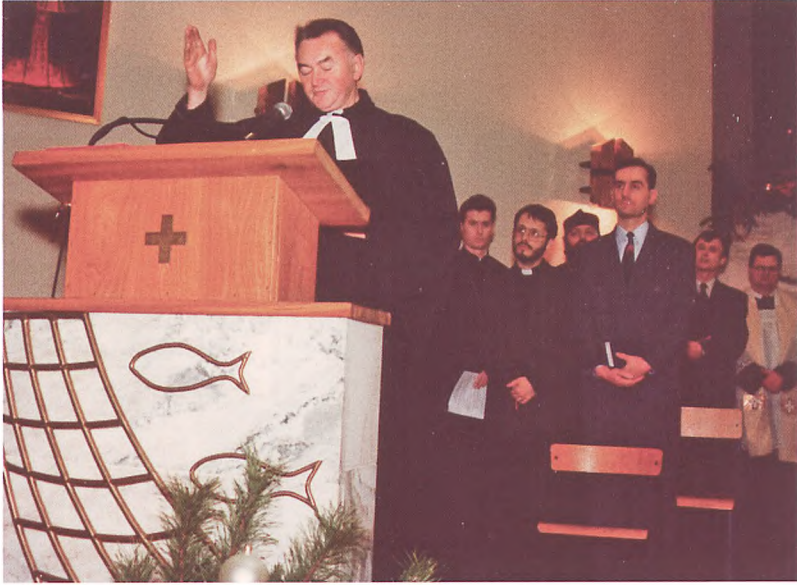
Podczas nabożeństwa ekumenicznego