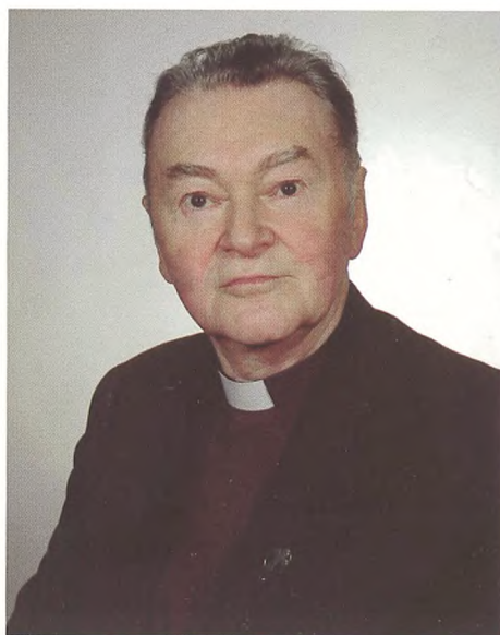
Ostatnie zdjęcie służbowe