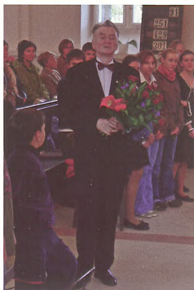
Podczas nabożeństwa z okazji 70-lecia urodzin w warszawskim kościele Wniebowstąpienia Pańskiego