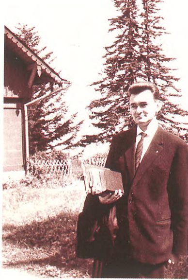
W Karpaczu – pierwszej samodzielnej parafii