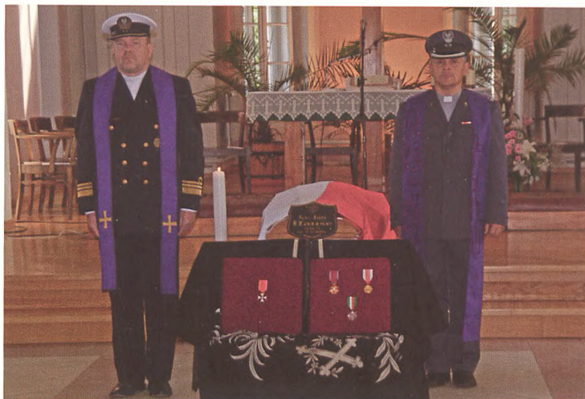
Pożegnanie Naczelnego Kapelana EDW w kościele Wniebowstąpienia Pańskiego w Warszawie