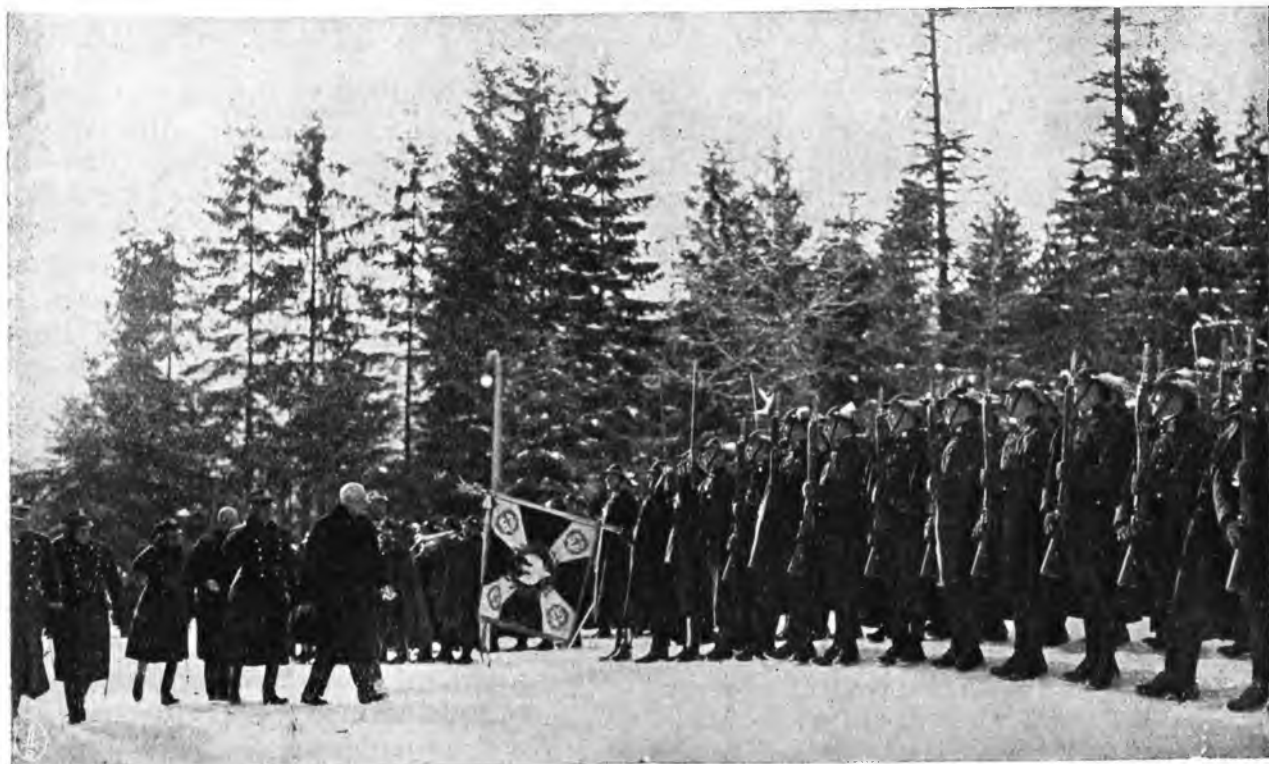
Hołd wojska w dniu imienin p. Prezydenta Rzeczypospolitej w Wiśle. Pan Prezydent przed frontem 3 p. s. p.