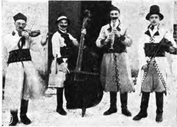
Koło amatorskie 22 bataljonu K. O. P. Muzykanci-wieśniacy przygrywający u złobka, w czasie przedstawienia „Betleem polskie”.