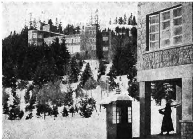
Zameczek Prezydenta Rzeczypospolitej w Wiśle, ofiarowany przez ludność wojew. śląskiego.