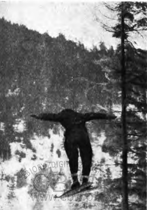
Lankosz w skoku