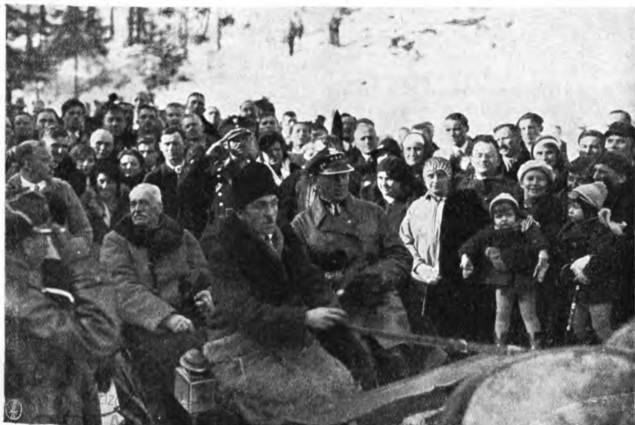
Pan Prezydent opuszcza zawody narciarskie akademików o mistrz. Polski w Wiśle, żegnany owacyjnie przez zgromadzoną ludność.