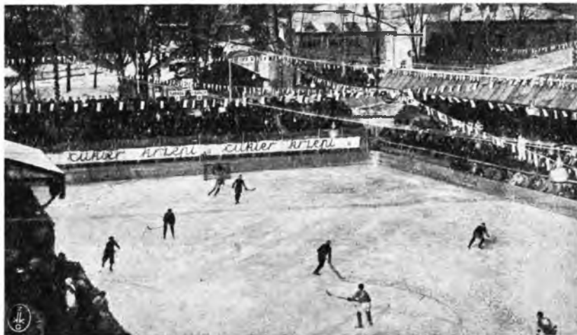
Międzynarodowe zawody hokejowe w Krynicy. Ogólny widok toru hokejowego w czasie zawodów.