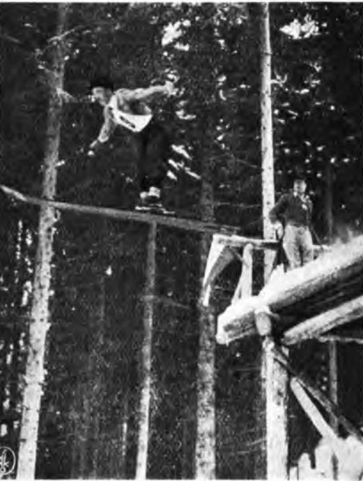
Skok jednego z zawodników gdańskich.