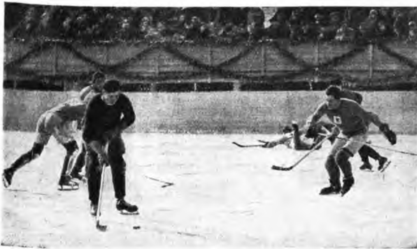
Międzynarodowe zawody hokejowe w Krynicy. Fragment z meczu Kanada - Francja. Walka o krążek.

70 milj. zł. gwarancji kredytowej dla Rosji sow. Przy sprzedaży na kredyt większych partij towarów polskich dla Rosji sow., rząd polski udziela sprzedającym gwarancji, t. zn. przyjmuje na siebie odpowiedzialność za spłatę należności przez odbiorcę, czyli przez Rosję sow. Oczywiście rząd nasz polega w tym wypadku tylko na dobrej woli rządu związkowego Z. S. S. R., a gwarancji udziela w celu umożliwienia dojścia do skutku sprzedaży wyrobionych u nas towarów. Z gwarancji tych korzysta przeważnie przemysł hutniczy na Górnym Śląsku oraz włókienniczy (Łódź, Tomaszów, Białystok). Wysokość dotychczas udzielonych gwarancji sięga 70 milionów zł.