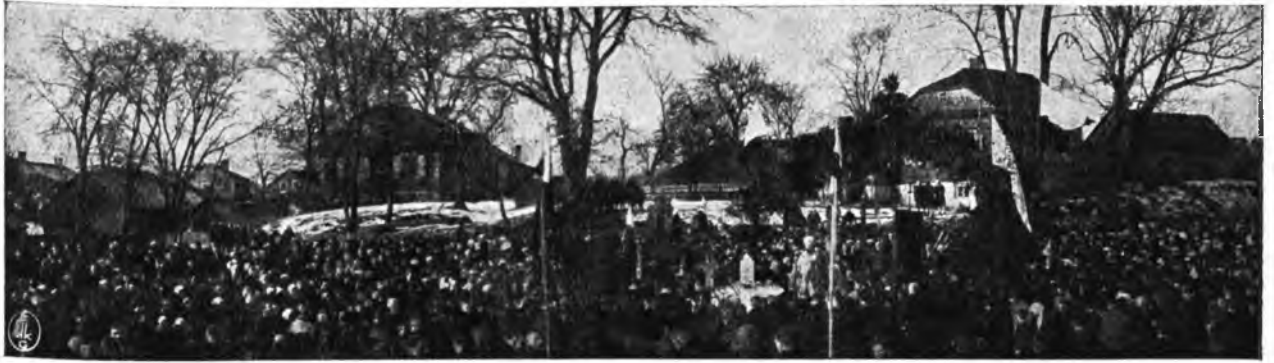
Uroczystość Jordanu w Pińsku.

jakie musieliśmy pokonać wystarczy fakt, że instruktorka P. B. K. musiała prosić każdą mamusię o „wypożyczenie” córki na zabawę. Trudno, żołnierzyki nie mają czasu na to, ucząc się sztuki wojennej.