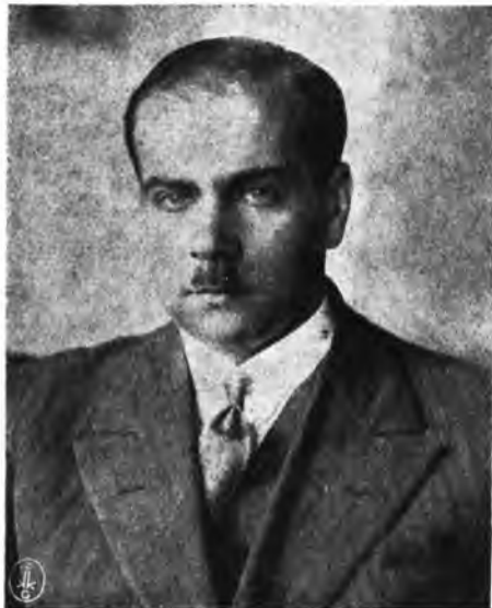
Minister Skarbu Ignacy Matuszewski.

może postawić Sejm albo Rząd. Projekt ten przechodzi w Sejmie przez tak zwane trzy czytania. W pierwszym czytaniu odsyła Sejm projekt ustawy do komisji celem szczegółowego zbadania. Komisja, składająca się z przedstawicieli Sejmu, a więc z posłów, bada szczegółowo każdy paragraf projektu i może go zmienić, a nawet całkowicie odrzucić. Poczem wyznaczony przez komisję referent ustawy przedstawia ją Sejmowi, który znowu zastanawia się nad nią, może poczynić pewne poprawki i t. p. Jest to drugie czytanie, po którym Sejm odsyła projekt znowu do komisji. W trzecim zaś czytaniu Sejm głosuje nad całym projektem.