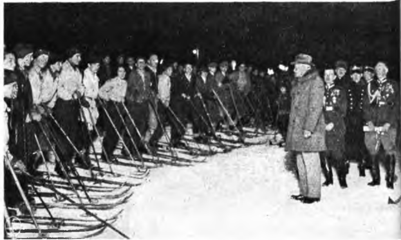
Hołd i życzenia imieninowe składają o. Prezydentowi członkowie p. w. ze Śląska i akademicy-zawodnicy z całej Polski i Gdańska.