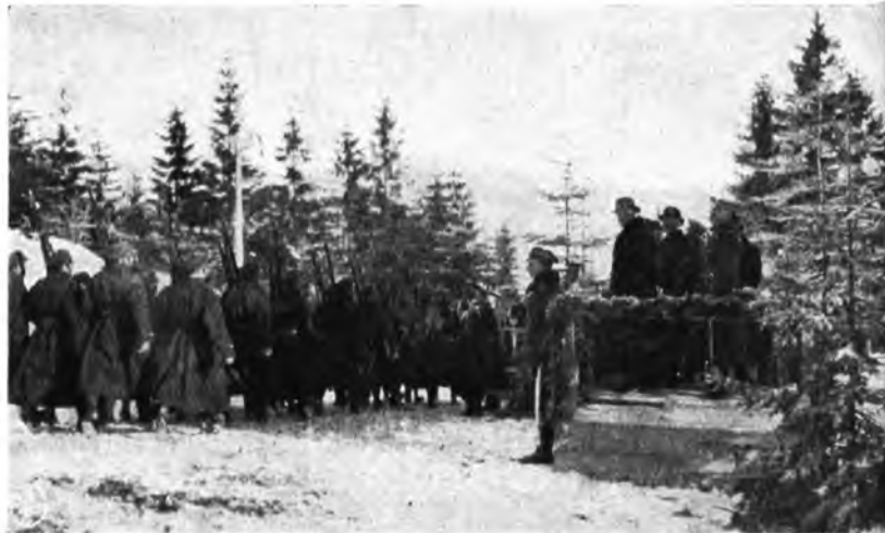
Defilada Strzelca przed p. Prezydentem.