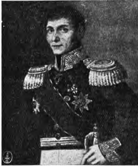
Gen. Franciszek Żymirski zginął pod Olszynką Grochowską 25.II. 1831.

Obie strony nie za- mierzały stoczyć walki 19 lutego. Chłó- picki chciał tylko zmienić dywizję Żymirskiego i potem wycofać Szem- beka na stanowiska prawego skrzydła, leżące między Grochowem I a Grocho- wem II, Dybicz zaś postanowił w tym dniu opanować wyloty dróg z lasu, leżącego na przedpolu pozycji gro- chowskiej. Tymczasem dzień zaczął się wycofaniem Żymirskiego z pod Miło- sny, który około godz. 10-ej przedłużył swą dywizją lewe skrzydło dywizji Szembeka. Wkrótce potem z lasu wy- nurzyła się idąca po szosie siedleckiej kolumna rosyjska, sformowana w dzi- wny sposób z pułku kozaków, 4 bata- lionów strzelców, 22 szwadronów ja- zdy i 18 dział. Dowódca rosyjskiej straży przedniej Łopuchin, nie bacząc