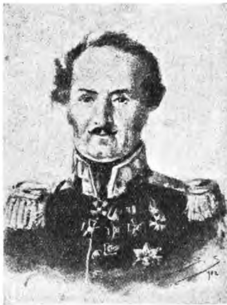
Gen. Piotr Szembek d-ca dyw. 1831 r

Przez cofnięcie się piechoty wpadła w krytyczną sytuację dywizja jazdy Łubieńskiego, szarżami broniąca się przeciw natarciom jazdy rosyjskiej z frontu. Ze względu na bagna, z tyłu poza jej stanowiskiem dochodzące do szosy, dywizja Łubieńskiego miała tylko jedną drogę odwrotu. Droga ta wychodziła na szosę koło karczmy wawerskiej, która lada chwila mogła wpaść w ręce rosyjskie. Wprawdzie Chłopicki na czele bataljonu grenadjerów usiłował ułatwić odwrót kawalerji, ale grenadjerzy, zaatakowani przez piechotę i kawalerję rosyjską, poszli w rozsypkę i dopiero Szembek, wytrzymując swe bataljony do ostatka przy karczmy wawerskiej, umożliwił wycofanie się Łubieńskiego.