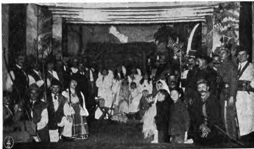
Koło amatorskie 22 bataljonu K. O. P. odegrało w Nowych Trokach i Landwa- rowie Betleem polskie — Rydla.