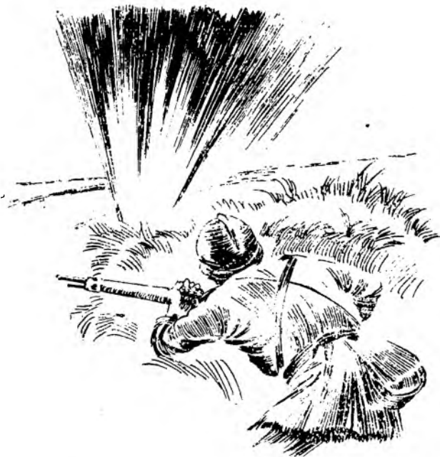
...huk pękającego tuż pocisku ocknął go...

Odczuwał chłód poranka sierpniowego, a przez opary mgły widział strzeliste wieżycy kościołów i dachy wysokich domów. Była to Warszawa. Widział na ulicach nieprzebraną ilość wojska i cywilów, wszystkich w jakimś bezładzie zmieszanych ze sobą i jak fale odbijających się od siebie. Te fale ludzkie porwały go i ponio-